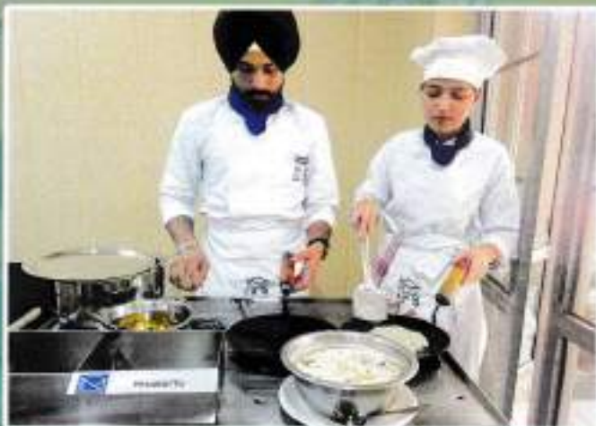
Andhra food live counter under EBSB