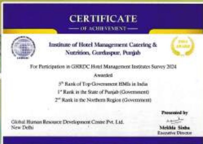
Another Feather in the cap