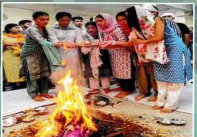
Auspicious beginning of the new academic session with Hawan