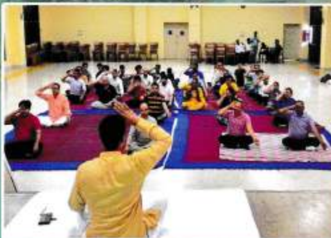
Yoga Session for Institute's Staff