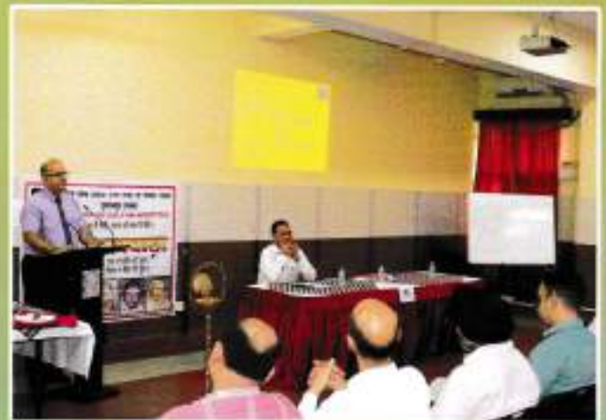
Hindi Pakhwada Udghatan Samaroh