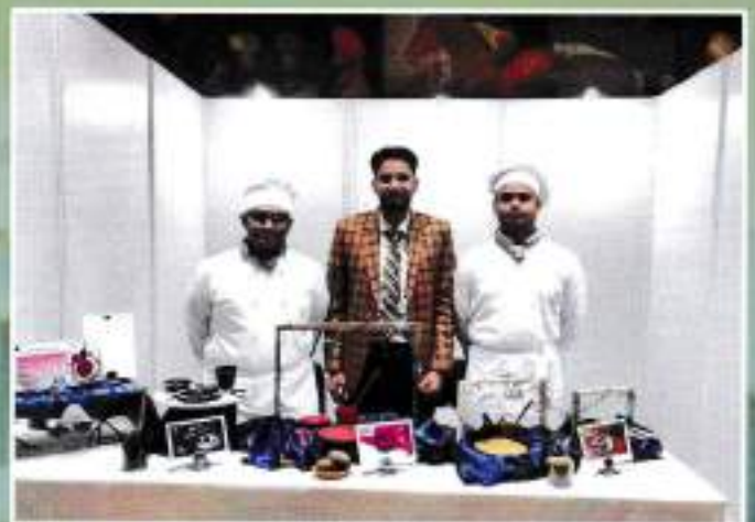
Design Challenge - 6th position in Edible Cutley Competition at NCHMCT, MoT